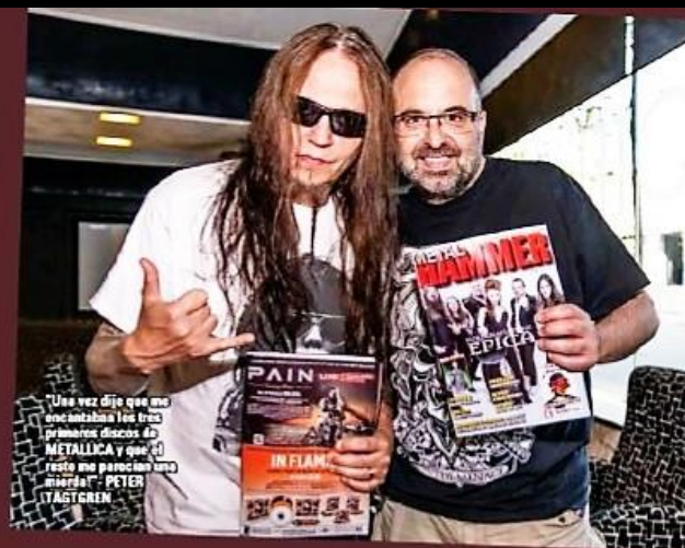
"Una vez dije que me encantaban los tres primeros discos de METALLICA y que el resto me parecían una mierda" - PETER TÄGTGREN

PETER TÄGTGREN, LÍDER VOCALISTA y GUITARRA de PAIN nos recibió en unos cómodos sofás de un hotel de la Ciudad Condal, estaba acompañado de un buen desayuno compuesto por café con leche más zumo de naranja tamaño XXL. Procedimos a las presentaciones protocolarias y la entrega de nuestro más reciente METAL HAMMER , el cual hojeó hasta dar con el anuncio inminente de lo que es su nuevo trabajo, "COMING HOME" . PETER TÄGTGREN se mostró reposado, amable, conversador y sin rehusar a ninguna pregunta. Así comenzó esta entrevista!