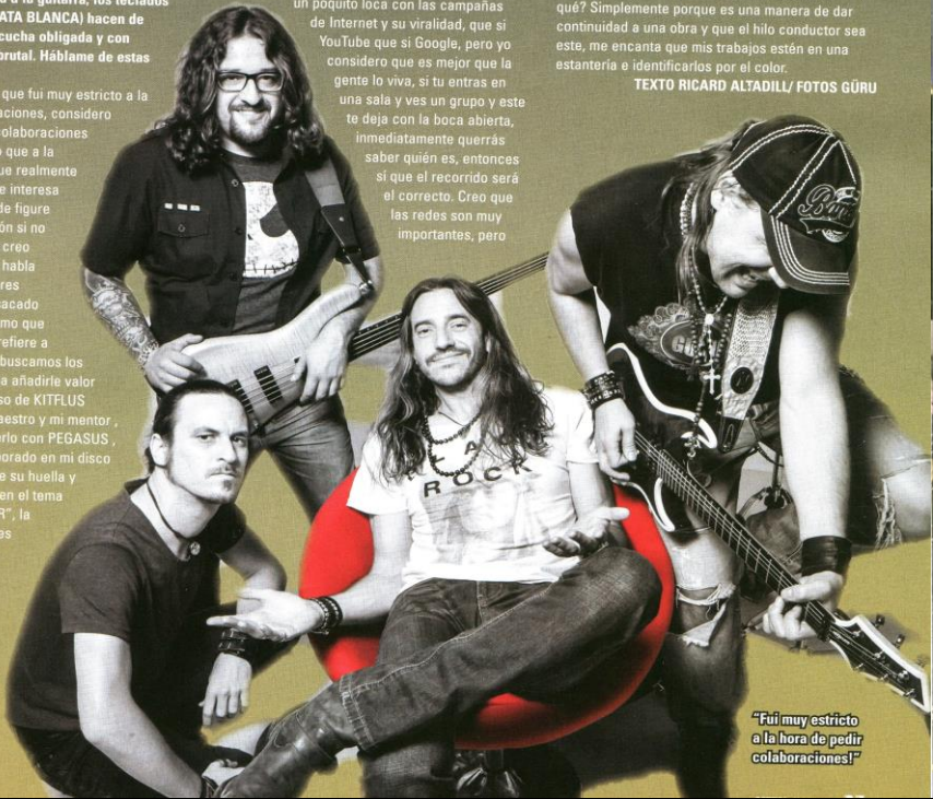
"Fui muy estricto a la hora de pedir colaboraciones!"

Realmente reconozco que fui muy estricto a la hora de pedir colaboraciones, considero que si un disco tiene colaboraciones tienen que ser primero que a la banda le apetezca y que realmente aporte algo más, no me interesa una colaboración donde figure un nombre de relumbrón si no aporta nada y además creo que hay discos que se habla más de los colaboradores que del grupo que ha sacado el disco, y eso pues como que no. Retomando lo que refiere a nuestro disco, cuando buscamos los colaboradores buscaba añadirle valor a lo realizado, en el caso de KITFLUS evidentemente es el maestro y mi mentor, yo con 14 años iba a verlo con PEGASUS, para mí que haya colaborado en mi disco es un honor y realmente su huella y clase queda plasmada en el tema "QUE ME DEJES HACER", la segunda colaboración es la del SR. DENANDER, él y yo ya hace años que nos conocemos porque trabajamos conjuntamente en el proyecto de BOBBY KIMBALL de TOTO, le propuse que me metiera un solo y me dijo que sí inmediatamente,