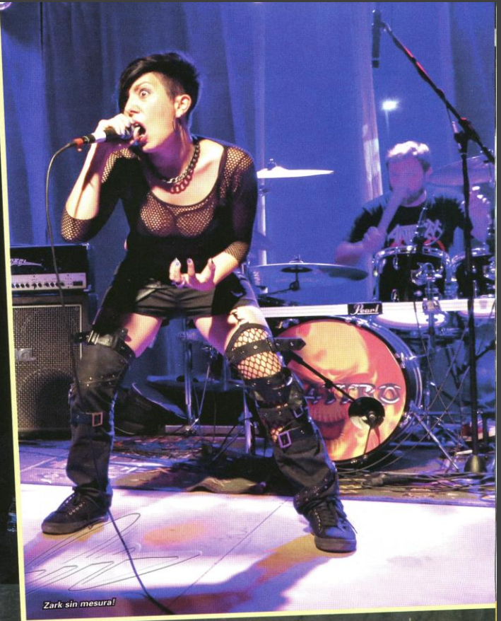
Zark sin mesura!

MH- Y la otra... habladme de "VOLTAGE" y este magnífico video. FLOHO y FERNANDO- IBÓN ANTIUÑANO es el director, que es un crack (ha grabado entre otros a SÖBER- BERRI TXARRAK- EL LANGUI- STEEL PUPPETS- ANKOR...) del video. Refleja muy bien esa mezcla de aspectos que somos DOCKA PUSSEL en ese tema e hizo